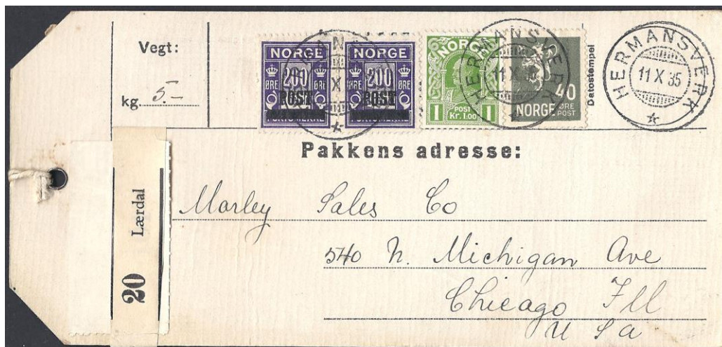
Pakke 3 – 5 kg.

Direkteruten var innstilt fra 19. juni 1940 til 8. oktober 1945.