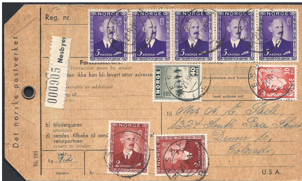
Pakke 9 – 10 kg.