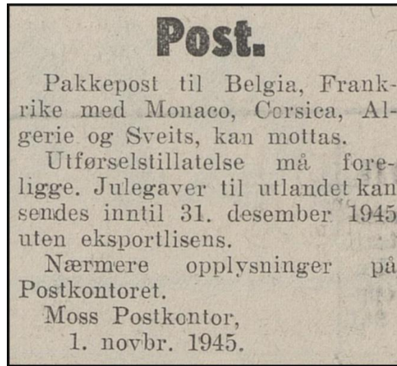
Moss Avis 3. november 1945

I rundskriv fra Poststyret, datert 30. oktober 1945, ble det informert om at pakkepost igjen kunne sendes til Sveits med direkte norsk båt til Antwerpen.